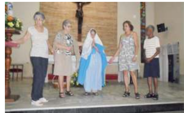
Dia das Mães - Peça Grupo de Convivência da Melhor Idade