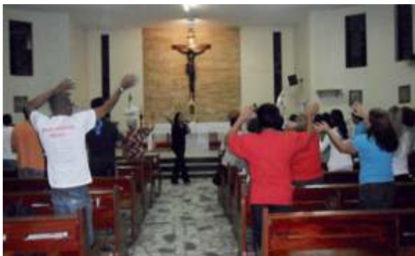
Vigília de Pentecostes