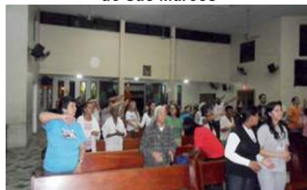
Vigília de Pentecostes