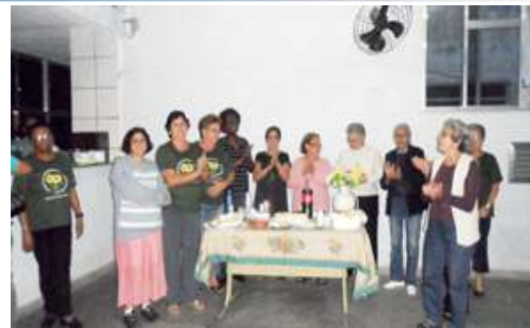
Comemoração Dia das Mães - Grupo de Convivência da Melhor Idade