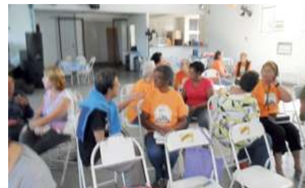
Formação Bíblica sobre o Evangelho de São Marcos