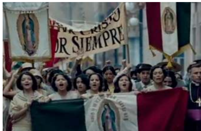
Uma imagem do filme Cristiada.