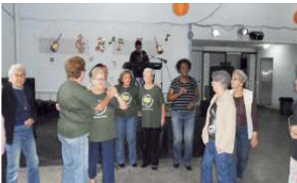
Comemoração Dia das Mães - Grupo de Convivência da Melhor Idade