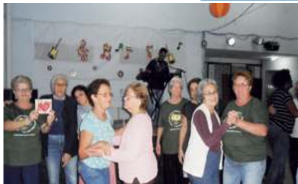
Comemoração Dia das Mães - Grupo de Convivência da Melhor Idade