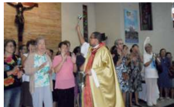
Dia das Mães - Peça Grupo de Convivência da Melhor Idade