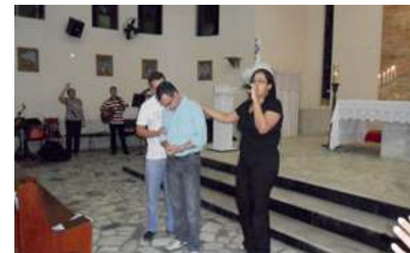
Vigília de Pentecostes