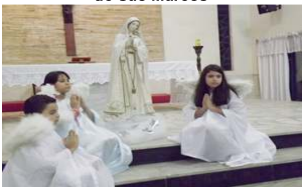
Missa com Coração de Nossa Senhora