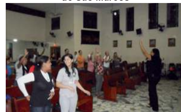
Vigília de Pentecostes