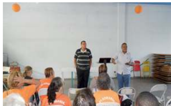
Formação Bíblica sobre o Evangelho de São Marcos