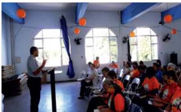
Formação Bíblica sobre o Evangelho de São Marcos