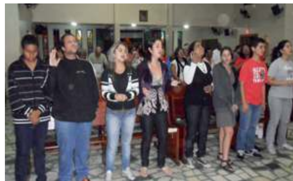
Jovens na Vigília de Pentecostes