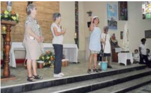
Dia das Mães - Peça Grupo de Convivência da Melhor Idade